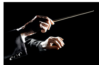
Gest dirijoral de închidere

Pentru a marca intrările, dirijorul va face un gest de invitație cu mâna întinsă și palma deschisă în plan vertical, în timp ce închiderile se execută prin strângerea mâinii în pumn, sau doar a degetelor, efectuând mișcări spre interior (pentru finalurile de frază) sau spre exterior (pentru finalul lucrării muzicale).