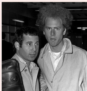
Simon & Garfunkel

Ascultă Scarborough Fair de Simon & Garfunkel.