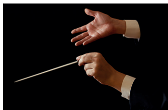
Gest dirijoral pentru crescendo

Gesturile dirijorale sunt executate cu ajutorul unui baton (bagheta dirijorală), în cazul dirijorului de orchestră sau doar cu mâinile, în cazul dirijorului de cor. Mâinile desenează în aer măsura cu ajutorul tactului dirijoral, înălțându-se pentru a solicita un crescendo orchestrei sau coborând pentru a semnaliza un decrescendo .