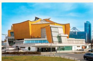
Filarmonica din Berlin