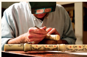
Fabricarea unui flaut din fildeș