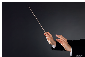
Gest dirijoral pentru decrescendo